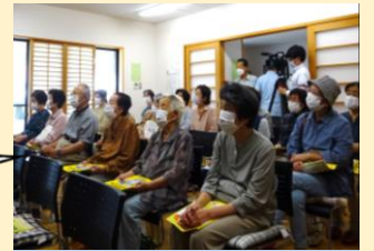
防災学習会(中州集会所)

参加者の声 「人と人のつながりが大切だと再認識した」 「いざという時のために、ふだんからとなり近所への声かけが必要」