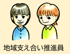
地域支え合い推進員

また、地域の仲間と散歩をする、近所同士で野菜のおすそ分けといった、 自然な支え合い は地域で安心して暮らし続けられることにつながります。地域にある「 つながり 」「 自然な支え合い 」を私たち地域支え合い推進員に教えてください。実際にお邪魔してその様子取材させていただき、素敵な笑顔が生まれる地域の「 つながり 」「 自然な支え合い 」を紀北町のみなさんにお伝えし、広めていきたいと思ひます。